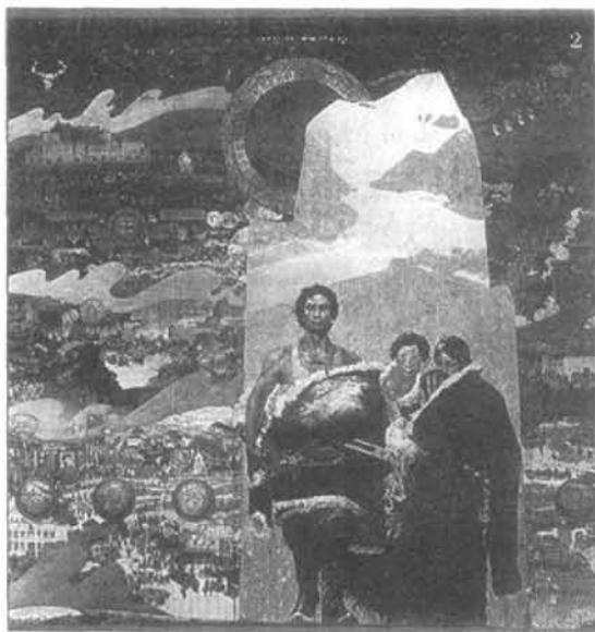
甘孜新藏画《雪山儿女》 作者:仁真郎加、梅定开、陈秉玺、吕树明