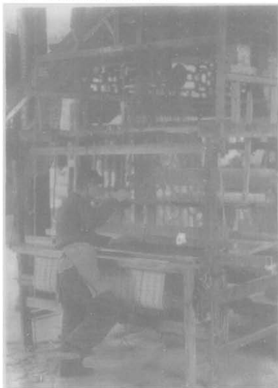
手工拉梭束综提花织机

轮连在一起，以右手拉绳，皮圈即沿梭盒内的沟槽行进，可织门幅 2.4~2.6 尺的宽幅布。12 小时可织长 5.2 丈的宽布半疋。到 20 世纪初，重庆、成都、绵竹、洪雅、铜梁等地已广泛使用，成为拉梭织机发展的兴盛时期。20 世纪 30 年代，拉梭木机被改良，俗称“游滩机”。该机对拉梭织机的卷布、放经机构加以改进，利用齿轮装置，使织机不停机就能完成移综、卷布、放经动作，进一步提高织布效率。