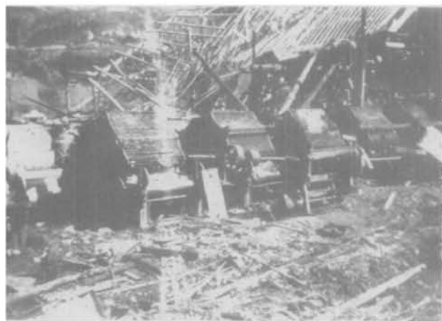
图为被炸毁的梳棉间

民国 29 年 9 月,在合川东津渡筹建合川支厂(民国 36 年改名为豫丰公司合川纱厂),将内迁的棉纺锭 1.5 万枚安装,于民国 30 年 5 月正式投产,有职工 2497 人。民国 31~33 年又增添英制泼拉脱棉纺锭 24780 枚(全程)。