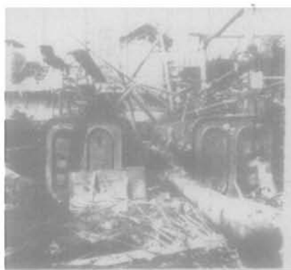
1940年5月27日豫丰和记纱厂重庆分厂遭受日机轰炸,损失惨重

豫丰纱厂 民国27年11月在重庆土湾临时席棚内简易投产1000枚棉纺锭。民国30年,在土湾建成厂房,占地325亩,实际安装棉纺锭3.5万枚,织机因缺件太多未安装。定名为河南郑县豫丰和记纱厂重庆分厂(民国36年改名为豫丰公司重庆纱厂),有职工3100人。因日机多次轰炸,损失惨重。