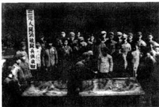
营山县三元公社用沙盘 给民兵讲解班进攻战术

四川民兵军事训练,随着形势任务的变化,国民经济的发展,民兵组织和武器装备的调整,而不断改进。经历了群众性练武、贯彻训练纲要和调整改革三个阶段,使训练逐步向正规化、制度化、规范化发展。