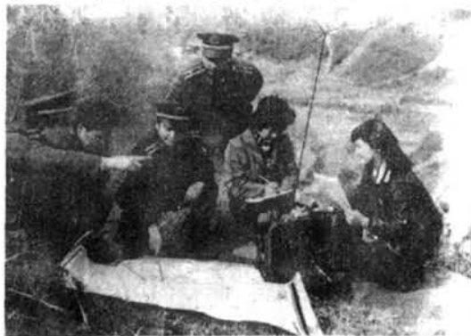
从实战出发训练民兵通信兵

截止 1975 年,《三年纲要》训练期满,专武干部连续参训 3 年,人数达 60% 以上的有西昌、达县、绵阳、乐山、内江、宜宾、温江、万县、南充、阿坝军分区和重庆警备区等 11 个单位;民兵营、连长连续参训 3 年,人数达 60% 以上的有 115 个县(市、区)。1976 年,对上述单位进行了考核验收,共考核专武干部 7120 名,对所学课目,达到会讲、会做、会教,能组织民兵训练,能带领民兵执行战斗任务(以下简称三会两能)的占 81.5%。考核民兵营、连长 57288 名,达到“三会两能”的占 75.7%。参加考核的武装基干民兵连 3667 个,考核武装基干民兵 352248 名,达到“纲要”要求的占 71%。考核不合格的单位进行了补训。民兵专业技术分队的训练也得到了加强,共训练高炮连 9 个,499 人,有两个连,参加了成都军区组织的实弹射击,均取得及格以上成绩;地炮班 441 个,3017 人;打坦克爆破班 77 个,