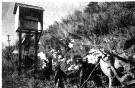
驻凉山地区部队和民兵 维护卫星通讯线路

1979年以来,四川省还先后6次组织民兵完成卫星回收的保障任务。民兵在观察落点、警戒现场、抢修道路、配合搬运中做了大量工作。1983年以来,全省有近5万名民兵,8次参加卫星发射通信线路的守护任务。四川省政府、省军区于1990年1月15日召开了护线表彰大会,奖励了38个先进单位和96名先进个人。